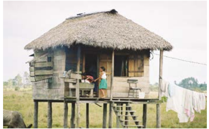
Dit helpt wel niet, want...

In veel risicogebieden hebben ze geen apparatuur om dit soort dingen te meten omdat daar geen geld voor is. Het Rode Kruis probeert te helpen door op die plekken vrijwilligers te zoeken die de bevolking waarschuwen als er een overstroming dreigt. Zij weten waar veilige plekken zijn om naartoe te gaan of kunnen helpen de huizen te beschermen tegen het water.