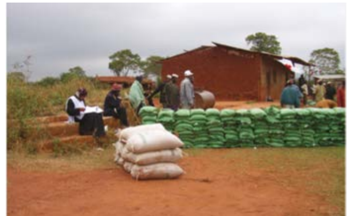
Dit helpt wel niet, want