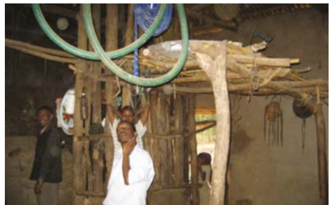
Dit helpt wel niet, want